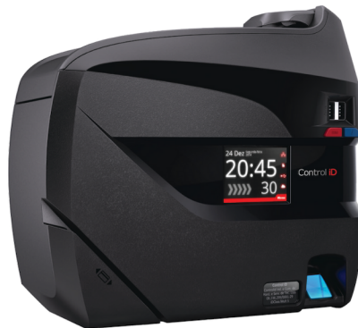
TABELA DE MODELOS